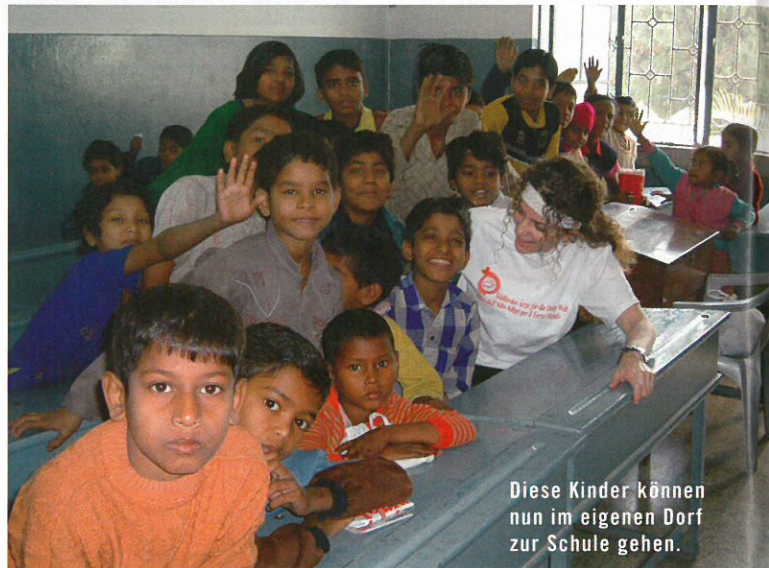
Diese Kinder können nun im eigenen Dorf zur Schule gehen.

den aus Südtirol finanziert. Jeden Samstag kommen Hunderte von Müll- und Straßenkindern zum Samstagprogramm. Dort werden Spiele im Hause von Don Bosco Ntika eine Grundausbildung für Computer.