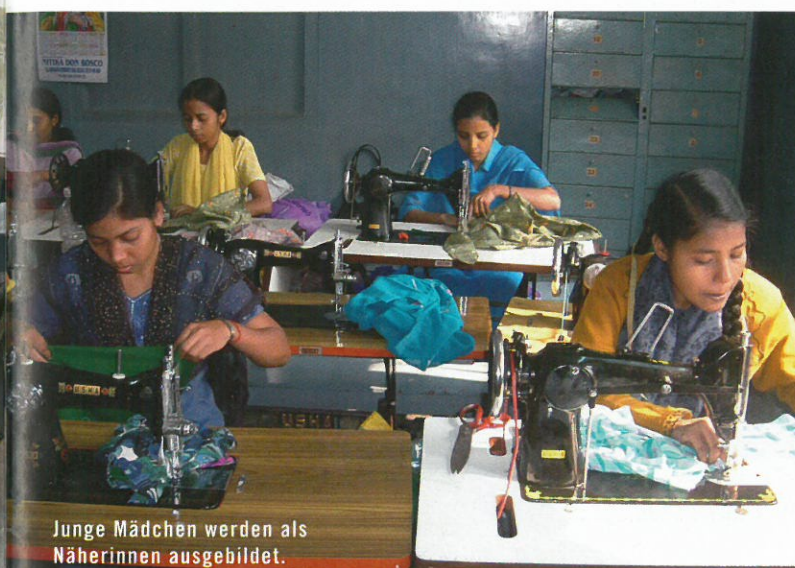
Junge Mädchen werden als Näherinnen ausgebildet.

Ich weiß, dass das ein langer Weg sein wird. Aber um das Problem bei den Wurzeln