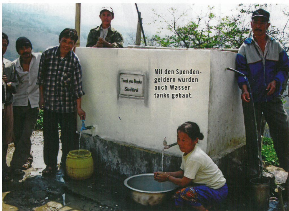
Mit den Spendengeldern wurden auch Wassertanks gebaut.

Im Namen der Ärmsten der Armen danke ich all jenen, die sich nicht abwenden, um jene zu sehen, die still vor sich hin leiden.